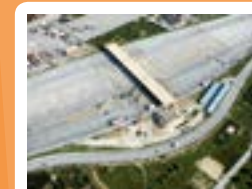
Autoroute Grèce Coût du marché: 2,1Mds€