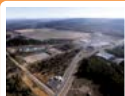
ITER Cadarache, France Coût du marché: 5,2Mds€