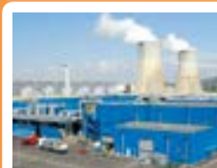
Georges Besse II Tricastin, France Coût du marché: 2 Mds€